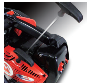
Reverse Start 2 Innowacyjny rozrusznik, jego specjalna konstrukcja zapewnia pewny i szybki start silnika.