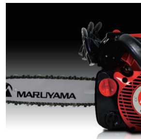
e-Just Opatentowany system napinania łańcucha. Sprawny naciąg łańcucha za pomocą dźwigni hamulca.

Lekka i wydajna pilarka do użytku profesjonalnego, niedościgniony stosunek mocy do wagi