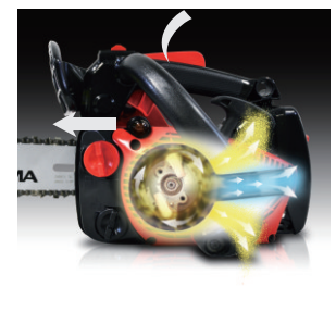
Pre-Vent System Do gaźnika dociera tylko czyste powietrze. Wióra, pył i kurz zostają odrzucone.