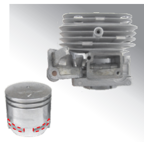
TECHNOLOGIA H.E.R.E. Dodatkowy cykl pracy silnika powoduje wzrost mocy ograniczając spalanie i emisję szkodliwych gazów